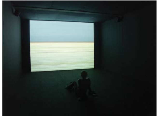
Flatland , Angela Detanico et Rafael Lain, © A. Detanico, 2004

« The cultural value of urban screens » par Susanne Jaschko le jeudi 1 er novembre 2007, à 12 h 30 R-M130, Pavillon des Sciences de la gestion métro Berri-UQAM