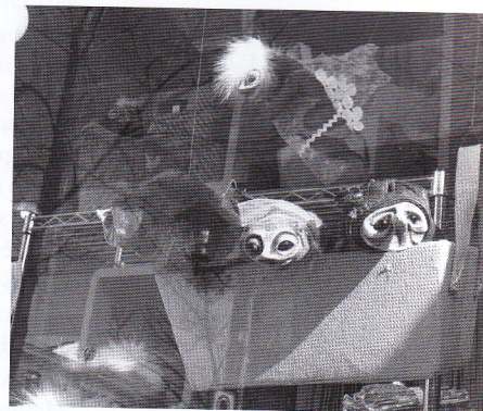
Vitrines de la rue Bernard à l'occasion des Trois Jours de Casteliers 2012.