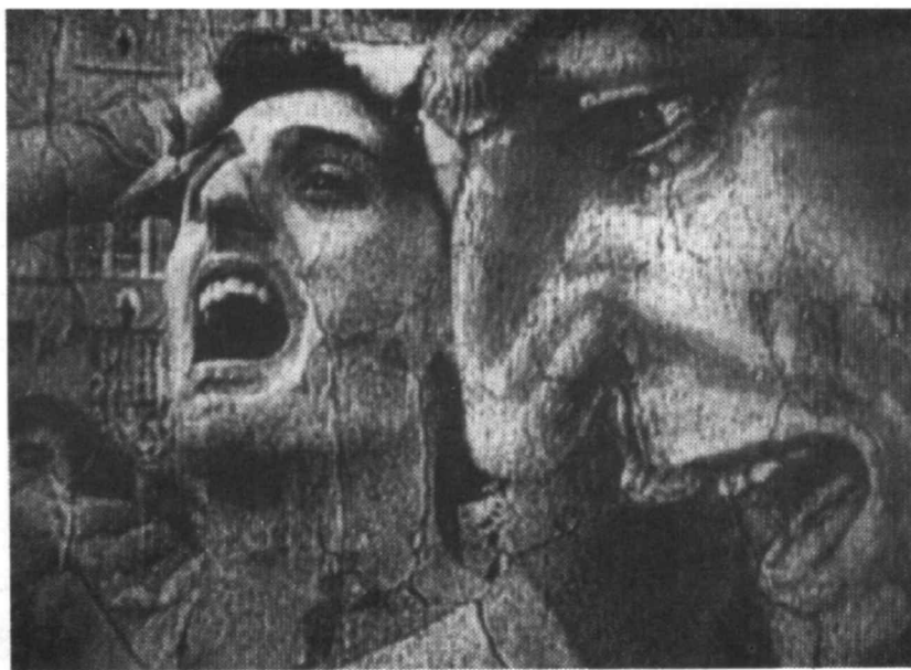
CITÉS ANTÉRIEURES : SIENNA