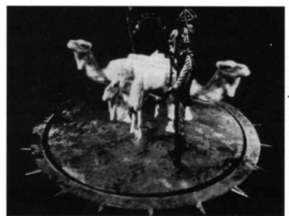
LE CIRQUE CONFÉRENCE

(extrait de "ESTIMATION" de Jean-Paul Fargier, déc. 1991)