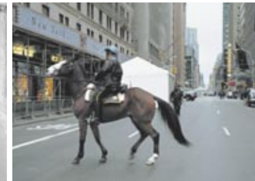
Interim, Andrea Geyer, 2002, journaux empilé et photo