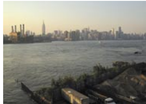
Midtown, Wolfgang Staehle, 2004, image extraite de la photo en continu