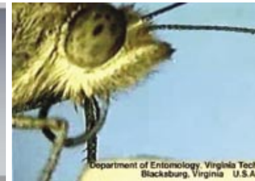
Unmovie, 2002, images du site Web