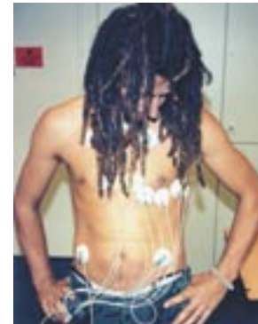
Outdoor Guy, Ulrike Feser, 2003, photo et vue d'installation