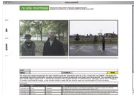
re:site montréal/project, Felix S. Huber et Florian Wüst, 2005, vue d'installation, images extraite du vidéo et du site Web