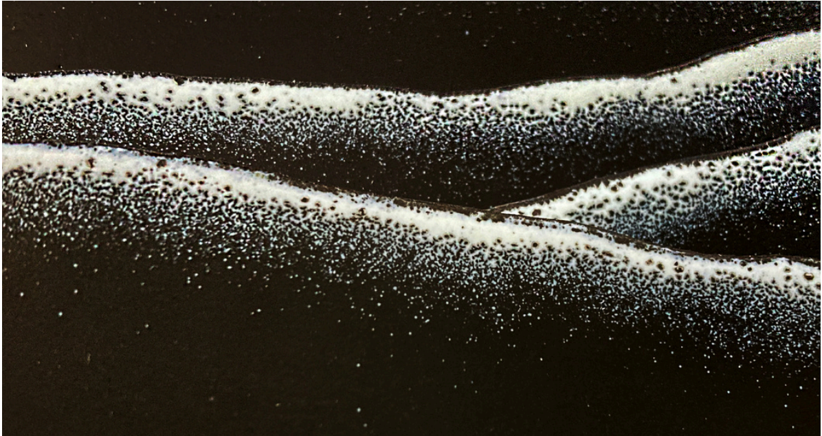
Yen-Chao Lin, As Above So Below (détail), 2024